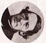
Lars Johan Hierta, Aftonbladets grundare och nära vän till Carl Almqvist.

Av allt att döma var det Hierta själv som skrivit den återhålllet sorgsna, i sak sensationella, nyhetsnotis Aftonbladet tryckte den 14 juni: ”Regementspastor C.J.L. Almqvist har saknats från