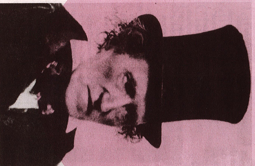
Carl Almqvist vid 71 års ålder, innan han lämnade USA.

”En excentrisk lånehaj som hämtad från en Dickensroman. En av mäktiga personer hatad diktare. En ung föräldralös flicka med operambitioner. Mystiska reverser. Arsenik. Kända historiska personer. Kärlek i teatermiljö. Historien om giftskandalen är som gjord för Netflix.”