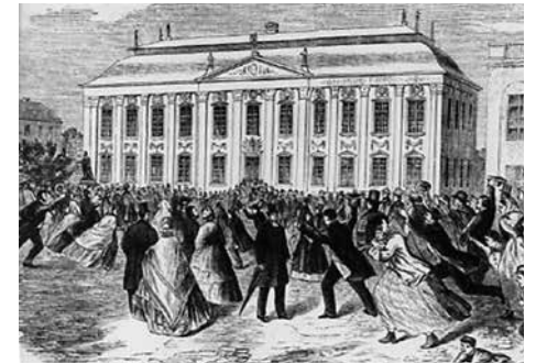
Jubel utanför riddarhuset 1865 efter den nya representationsreformens antagande. Ståndsriksdagen ersattes med en tvåkammarriksdag.

Då kan man först konstatera att skolfrågan låg honom synnerligen varmt om hjärtat. Det hade den gjort åtmins-