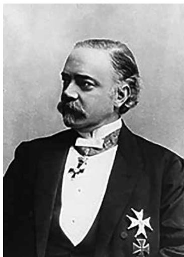
Carl David af Wirsén