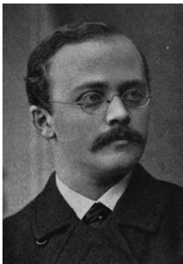
Gustaf af Geijerstam