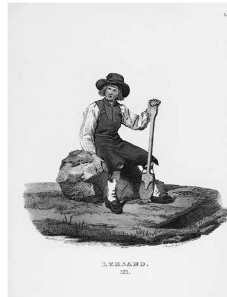
Bonde från Leksand, teckning av J.G. Sandberg från Ett år i Sverige, 1864.

åtminstone i Almqvists fall, särskilt med tanke på hans feministiska engagemang.